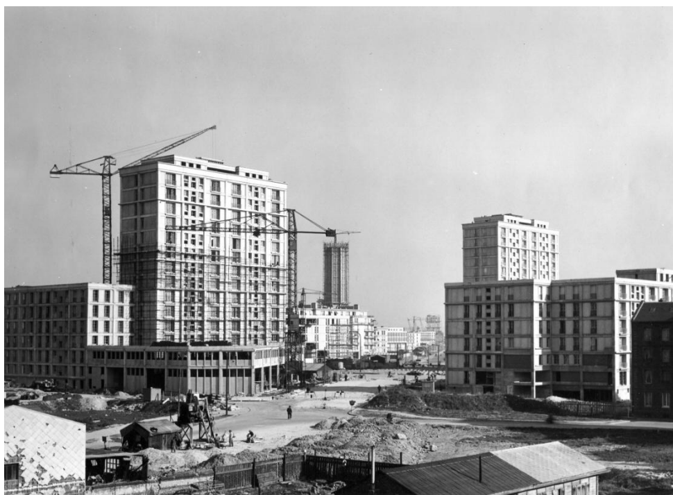
Le Havre. Boulevard François I er vers 1955.

Le Havre, 16 au 19 octobre 2024 au Théâtre de l'Hôtel de Ville